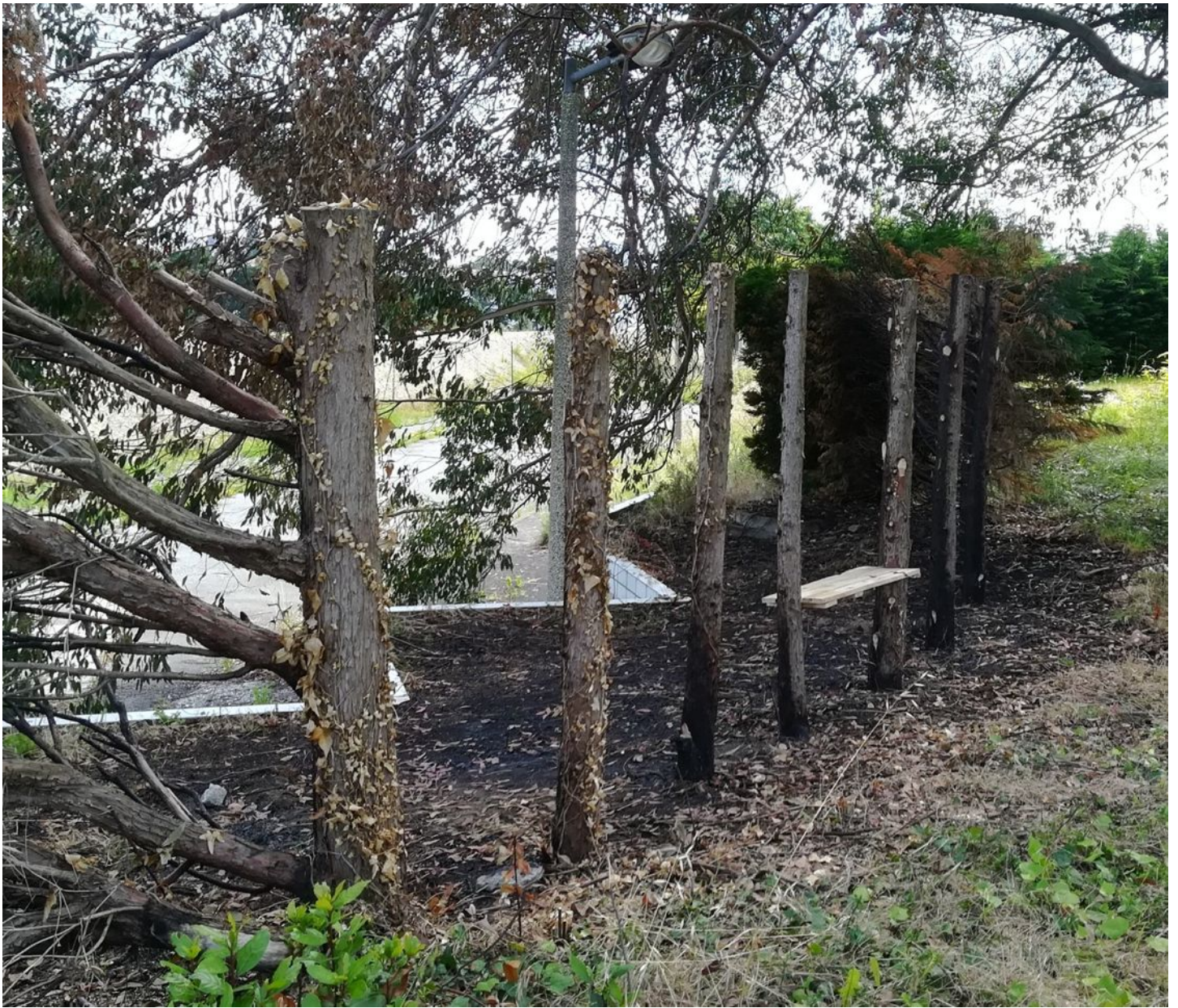
STAN LACOMBE, Le Banc (2020).