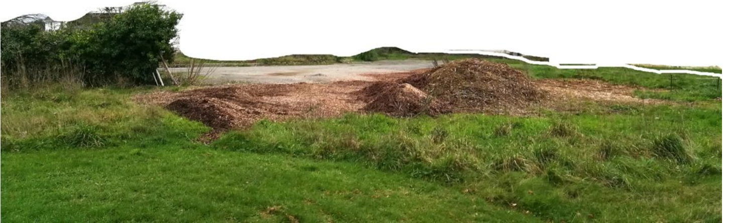
STAN LACOMBE, Tas, broyat déposé et laissé à disposition (2020).