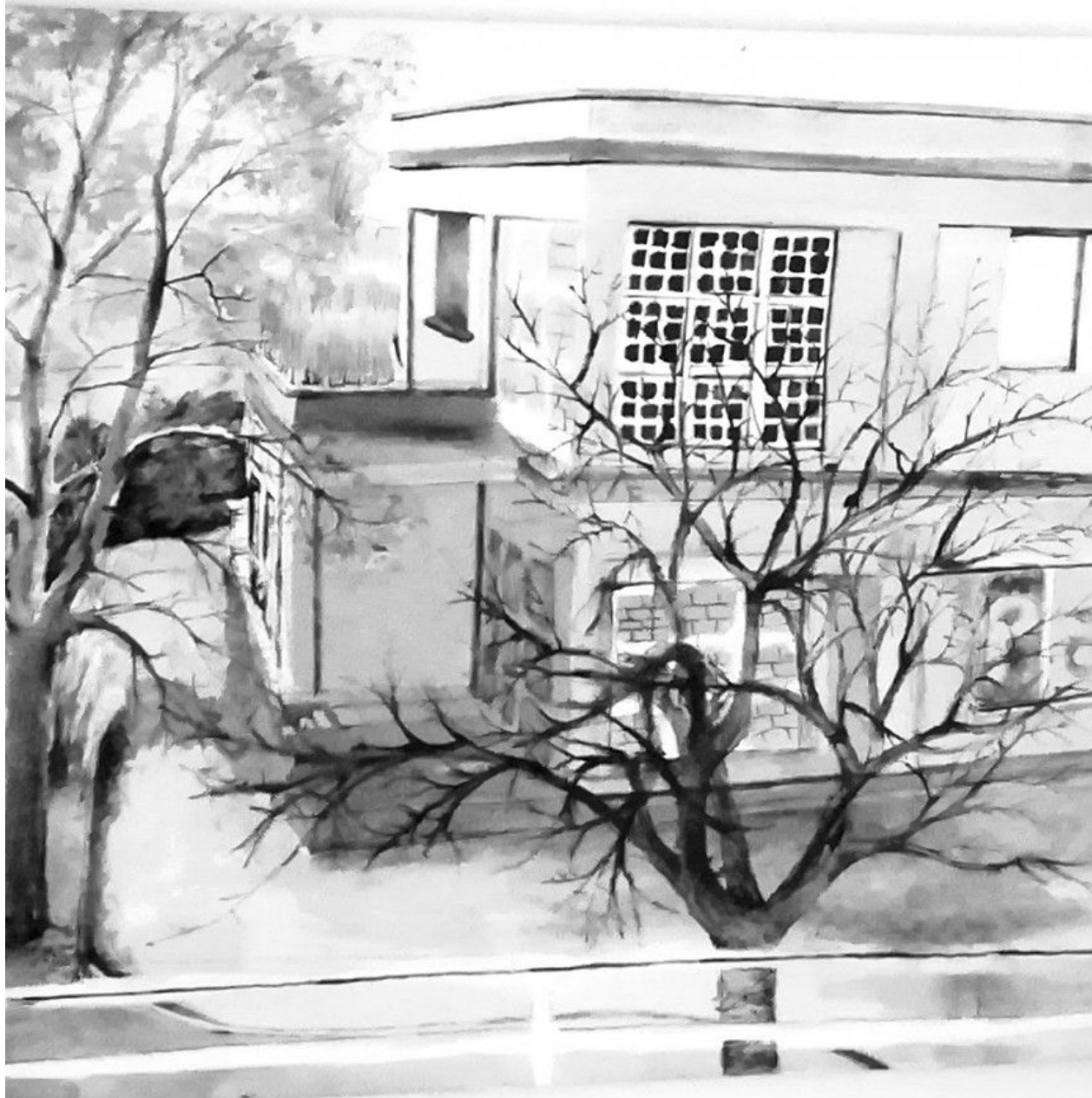
STAN LACOMBE, Jungle quatre-vingt-neuf (1), hommage à G & G, encre de chine (2020).