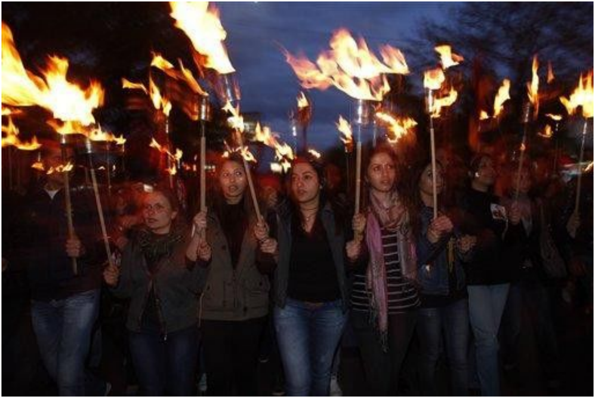
STAN LACOMBE, Base pour Feu de jungle 24 avril, Arméniens marchant vers le monument dédié aux victimes du génocide, à Erevan, en Arménie, en 2013.