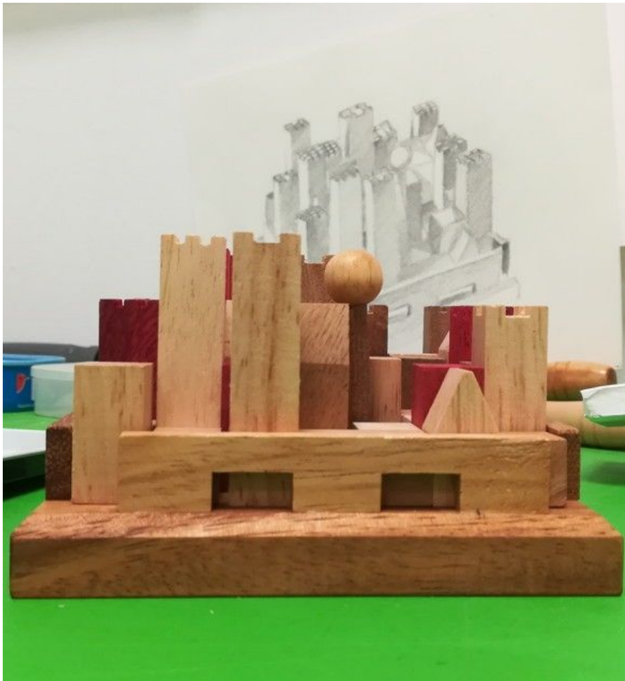
STAN GUILER (STAN LACOMBE), Base pour Reconstitution FLOR JILLIAN GUILER, La restauration et reconstruction du monde à partir du Pé et de Devils Tower (projection urbaine pour le site du Moulin du Pé), montage et dessins crayon graphite (2020).