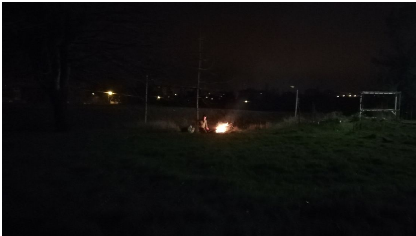
STAN LACOMBE, Feu de jungle, soutien au peuple Arménien (2020).