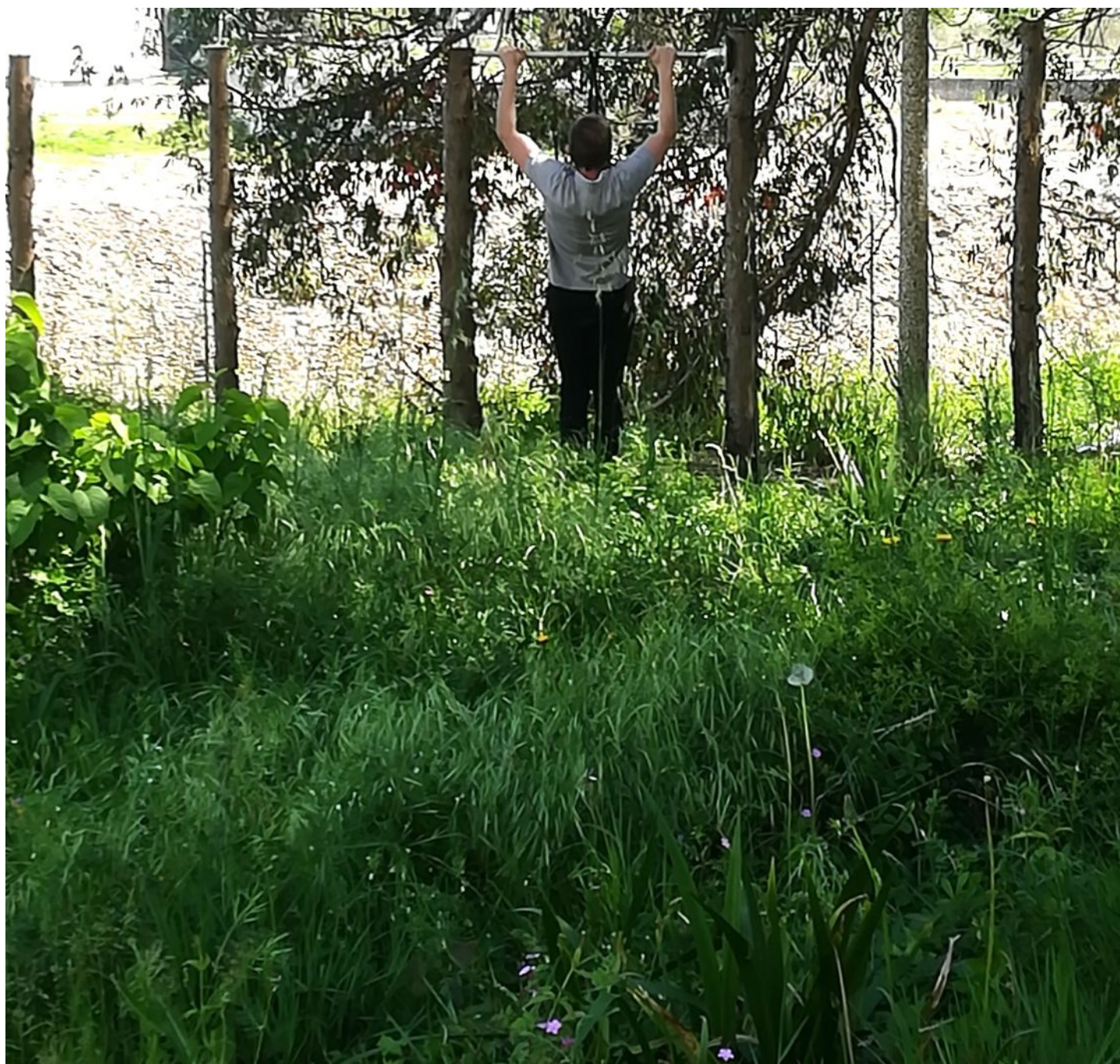
STAN LACOMBE, La Barre de Balançoire Interceptée, (2020).