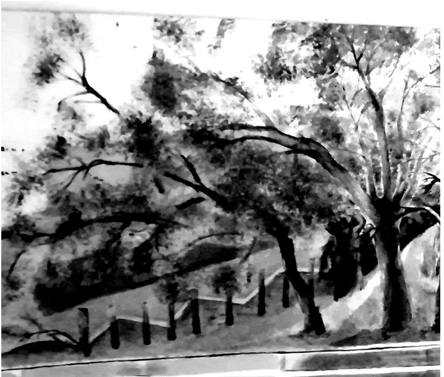
STAN LACOMBE, Jungle quatre-vingt-neuf (2), hommage à G & G, encre de chine (2020).