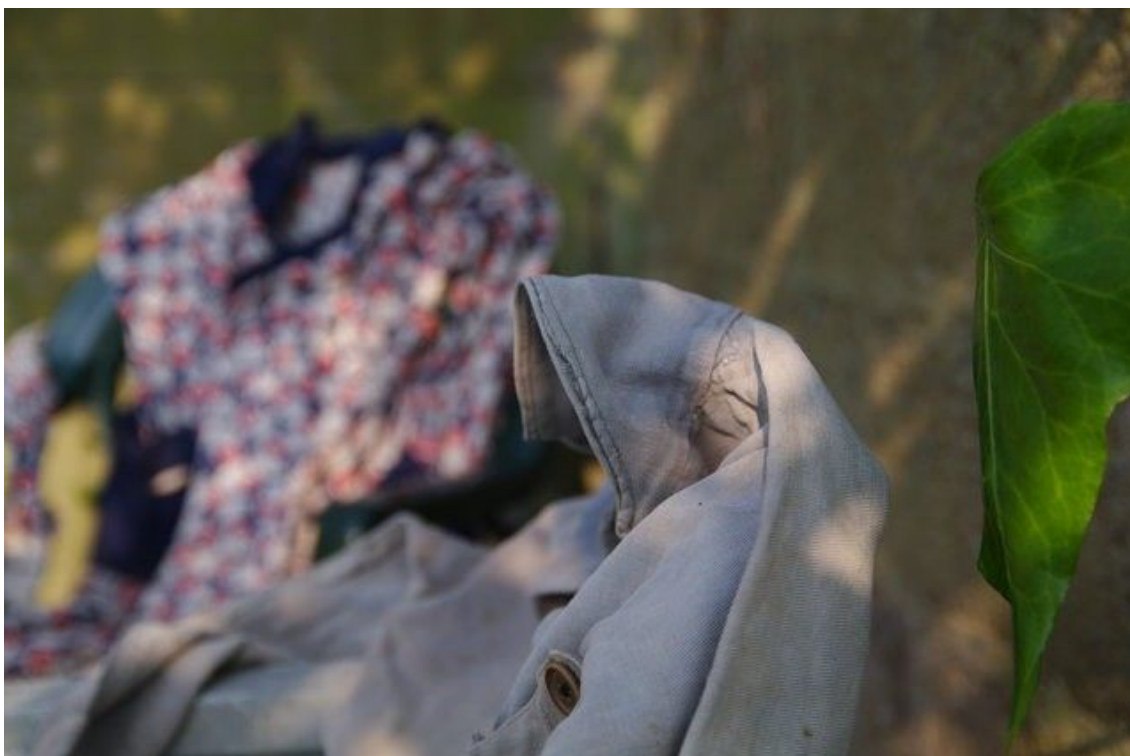
STAN LACOMBE, Deux Focales, installation photographée, dans la continuité de Le Monde d'Hier de Stefan Zweig (2020).