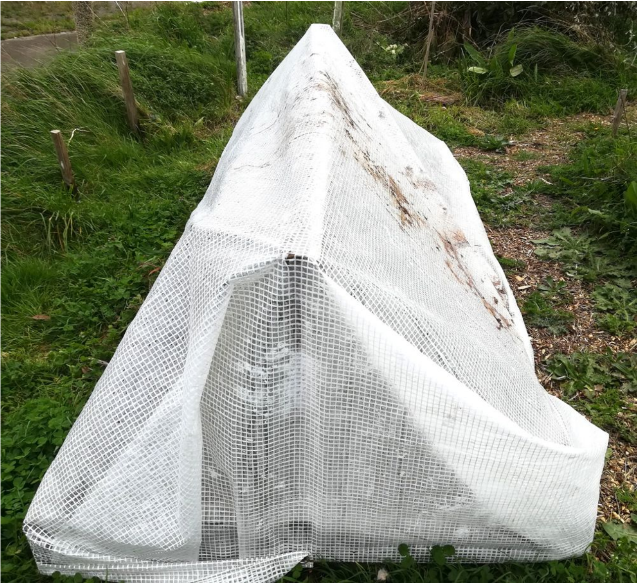
STAN CHRISTU (STAN LACOMBE), Tente de Fortune : Le Succès est l'Opium de l'Art, bâche de protection transparente (2020).