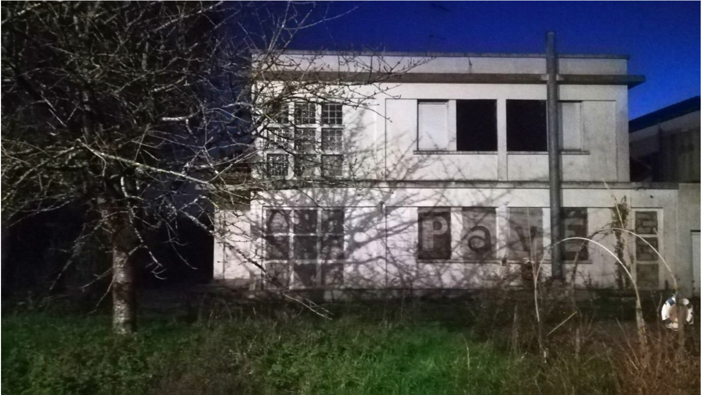
STAN LACOMBE, Vision nocturne du PavÉ, photo travaillée à partir d'images issues de caméra thermique, fresque en matériaux sympathiques (2019).