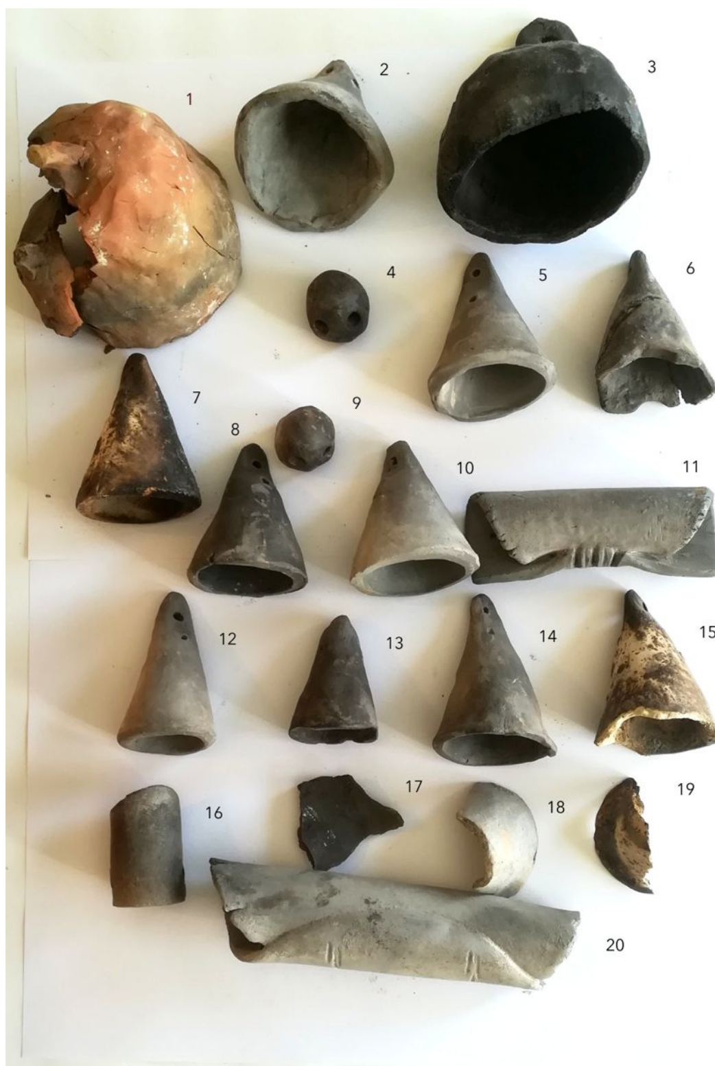
STAN LACOMBE, Les Cloches, série en terre cuite, 101 éléments, reconstitution des cloches des églises de l'agglomération nazairienne (2020). (avec les deux pages suivantes)