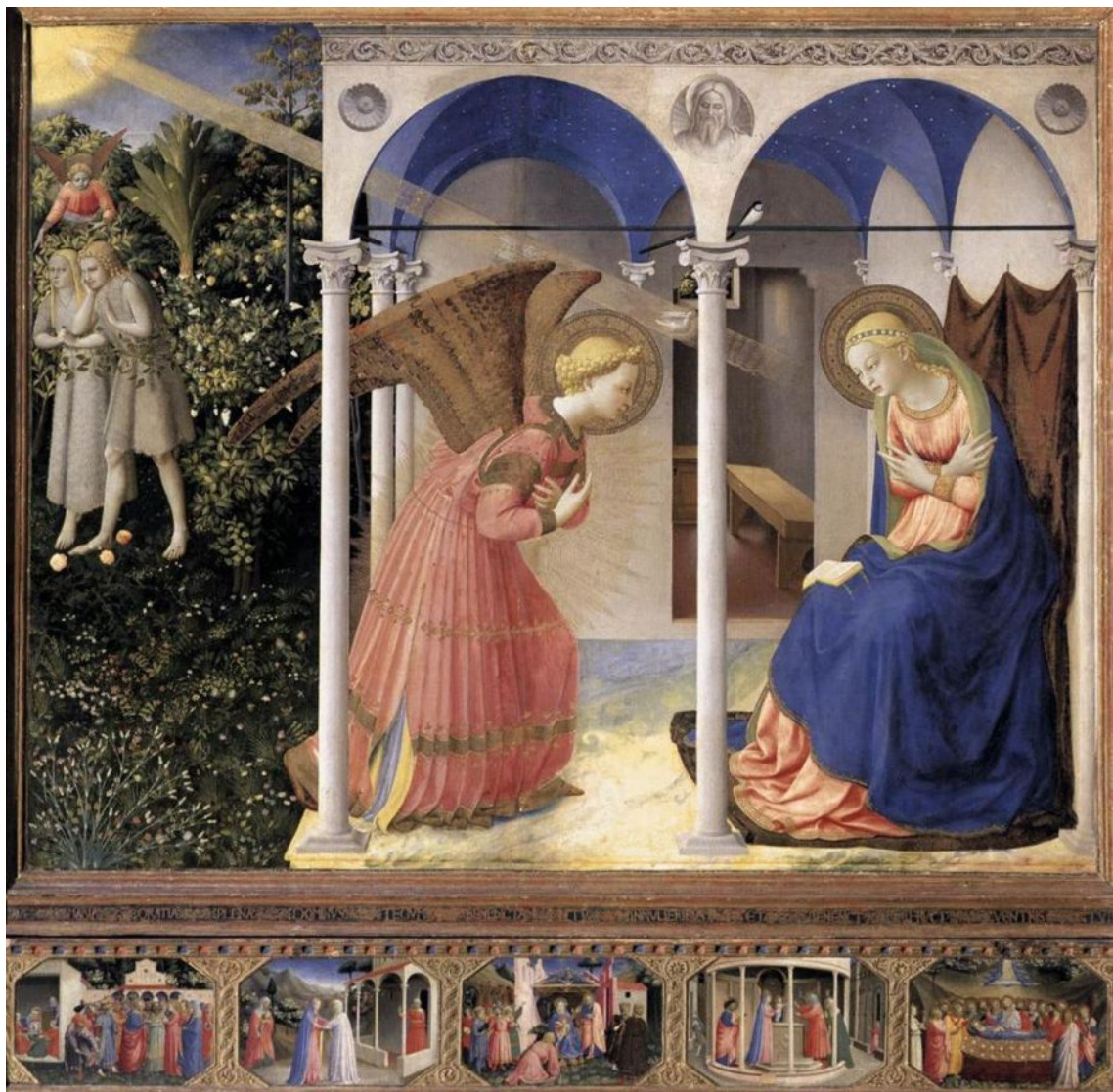
STAN ANGEL (STAN LACOMBE), Base pour Annonce FRA ANGELICO (Guido di Piero), Fresques de San Marco, L'Annonciation (1442-43), partie centrale d'un retable exécuté pour le couvent San Domenico de Fiesole.