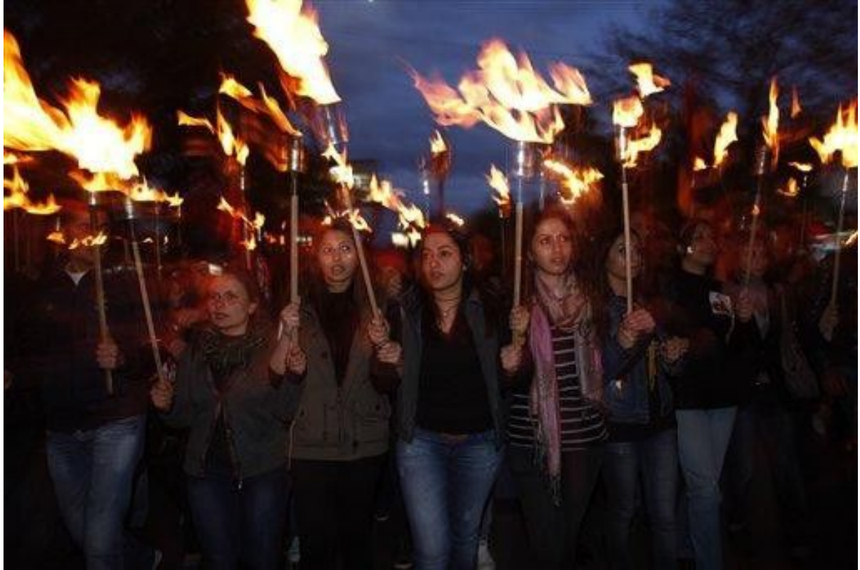
STAN LACOMBE, Base pour Feu de jungle 24 avril, Arméniens marchant vers le monument dédié aux victimes du génocide, à Erevan, en Arménie, en 2013.