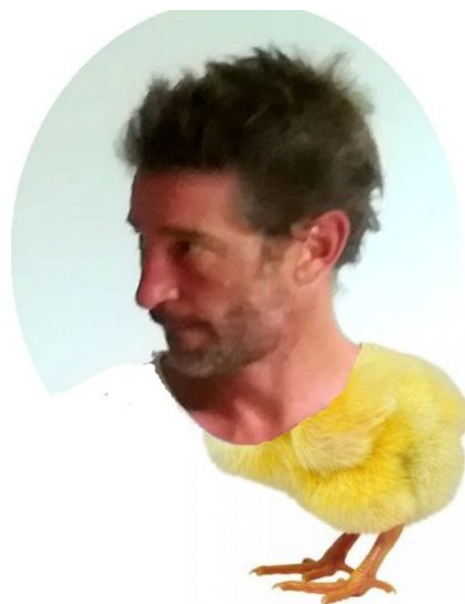
STAN LACOMBE, Essai d'Interception n°1 (le husky) (2020).