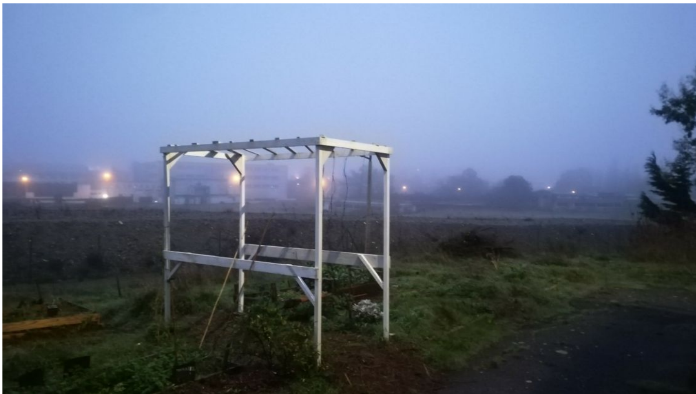
STAN LACOMBE, Abri de Jungle (3-en-1 : point d'observation, zone de dialogue avec le végétal, et rampe de lancement de bombes de semences vers le terre-plein), construction en bois au proportions exactes du bâtiment 89 (2019).