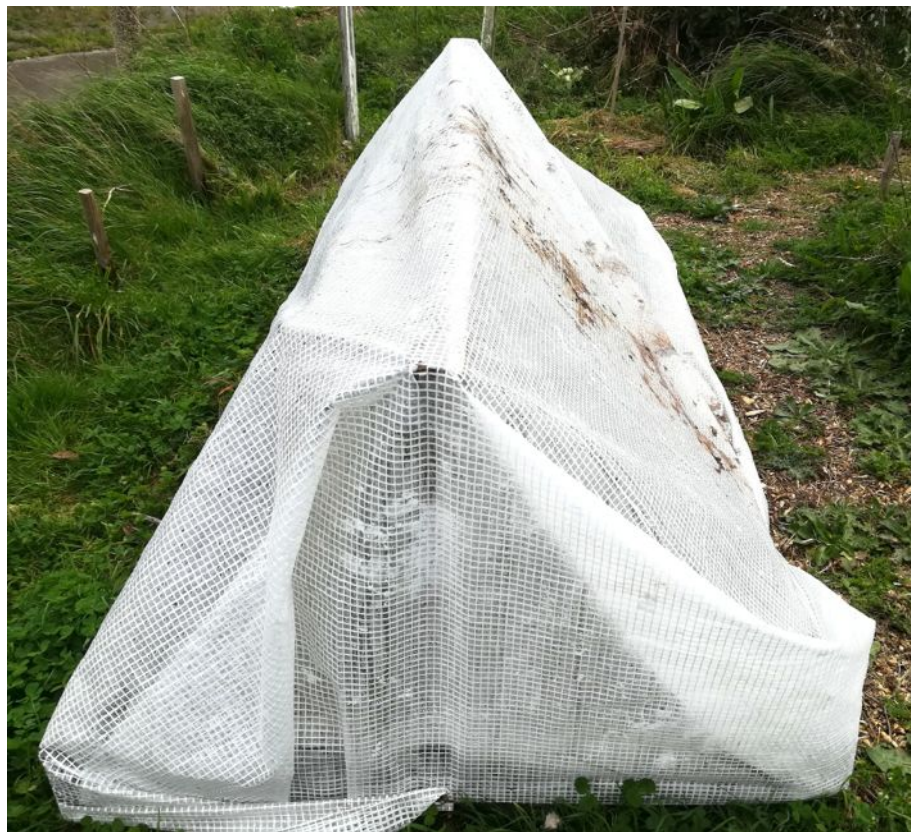
STAN CHRISTU (STAN LACOMBE), Tente de Fortune : Le Succès est l'Opium de l'Art, bâche de protection transparente (2020).