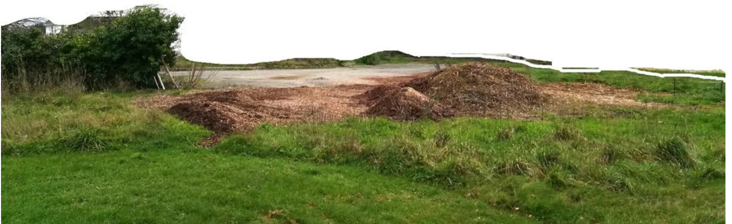
STAN LACOMBE, Tas, broyat déposé et laissé à disposition (2020).