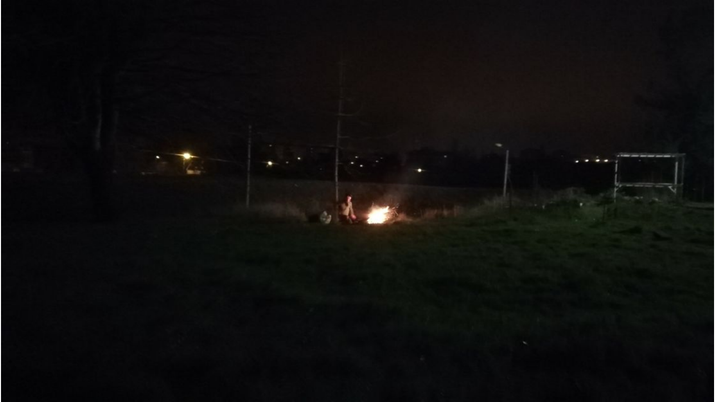
STAN LACOMBE, Feu de jungle, soutien au peuple Arménien (2020).