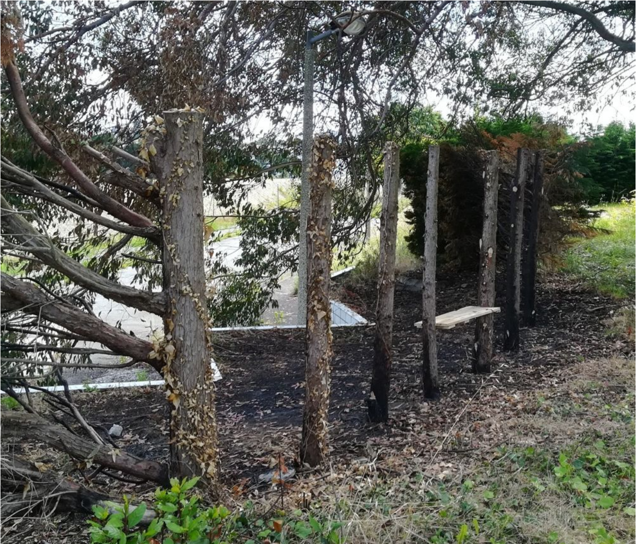
STAN LACOMBE, Le Banc (2020).