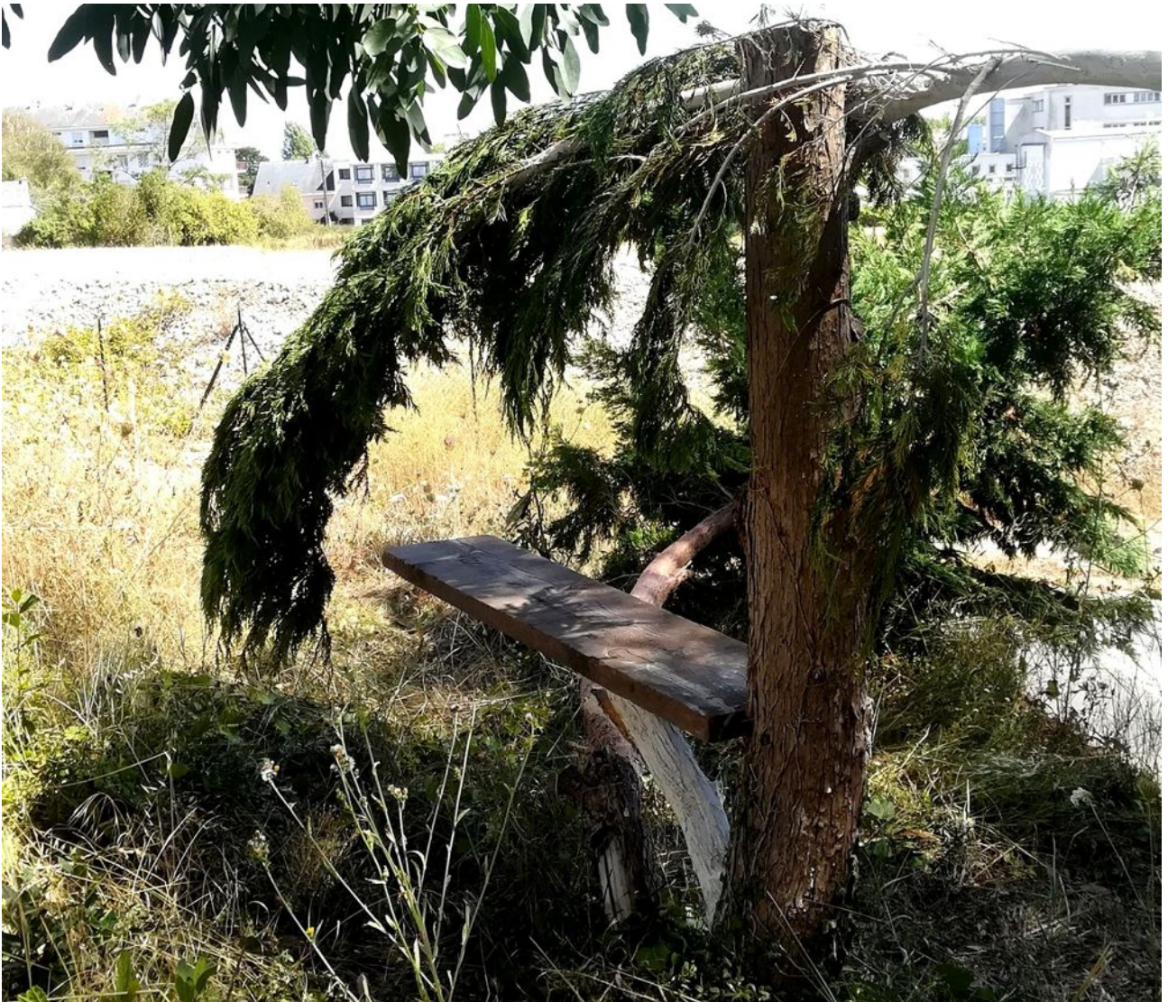
STAN LACOMBE, Le Deuxième Banc : le Banc-Plongeur (2020).