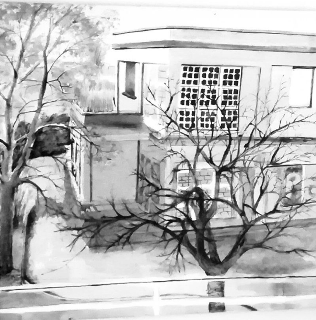
(en haut) STAN LACOMBE, Jungle quatre-vingt-neuf (1), hommage à G & G, encre de chine (2020).