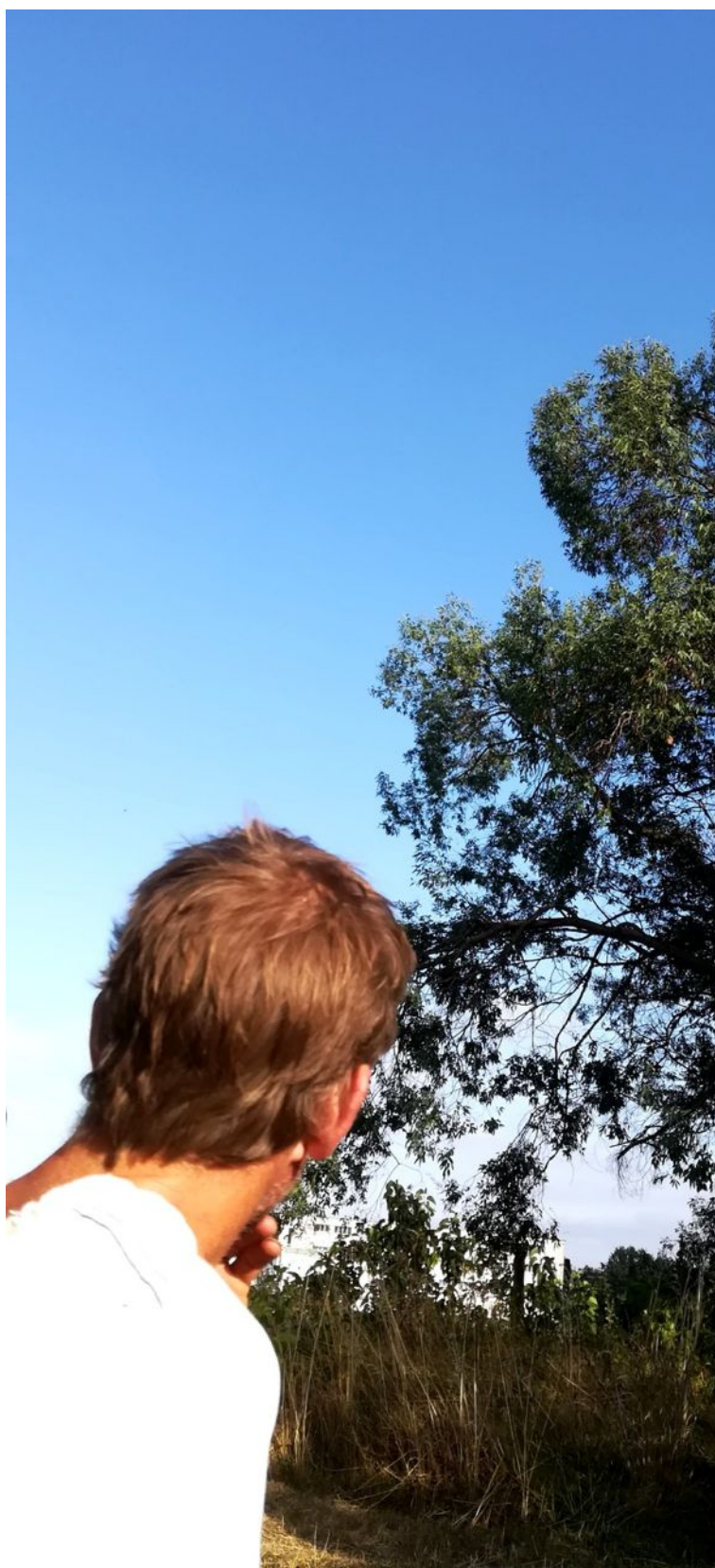
STAN LACOMBE, Interception Lointaine , (2020).