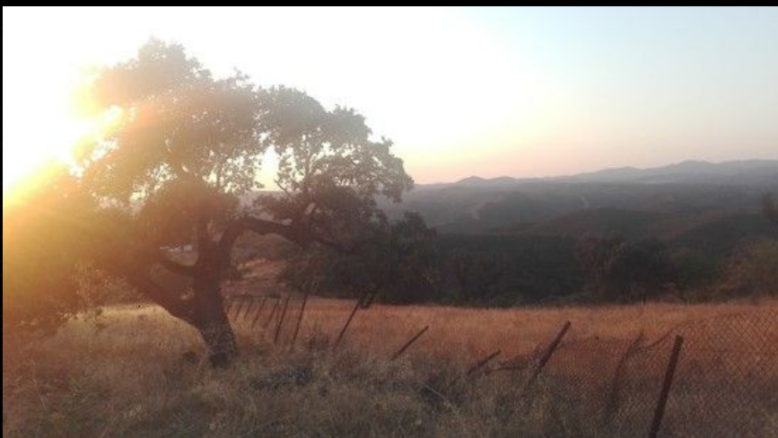
Première promenade avec des béquilles.