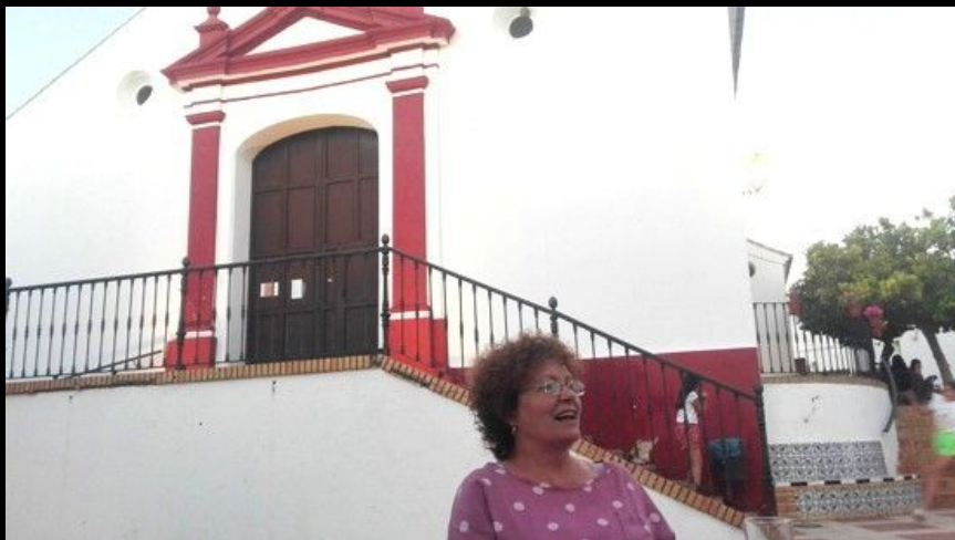
30 de junio. Conversation in the plaza del pueblo.