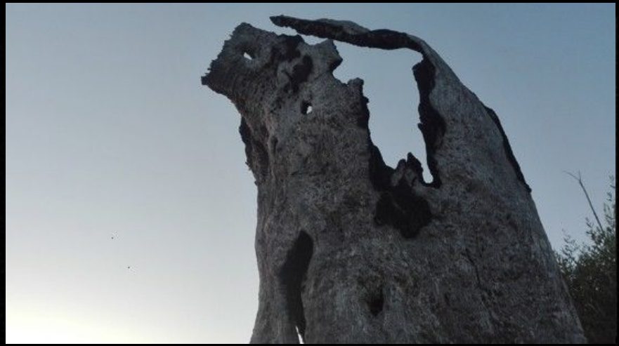
L'arbre de mas abajo est un superviviente.