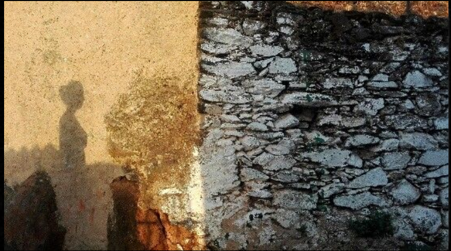
Las dos de San Juan.